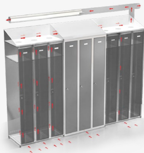
Variante mit zentraler Belüftung im Schrägdach

Die Farbe wird hochwertig einbrennlackiert. Sie ist in allen RAL-Farben und optional auch als Strukturack erhältlich. Weitere Details finden Sie im Datenblatt „Farben“.